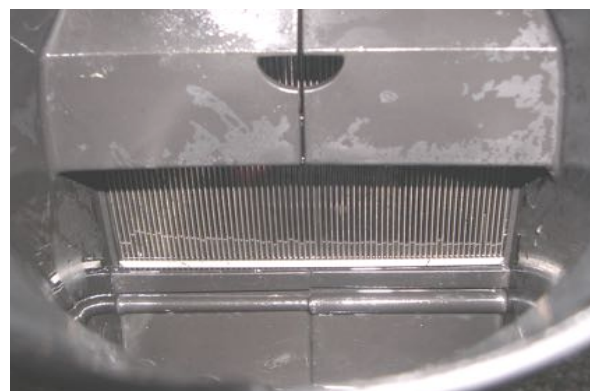
Gereinigde achterzijde van de filter na het gebruik gedurende enkele seconden van een hogedrukreiniger