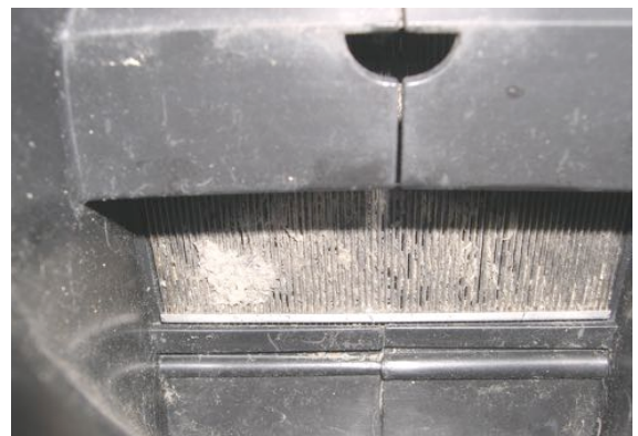
Achterzijde van een vervuilde filter